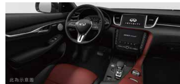
此為示意圖 深緋紅 (旗艦款，接單生產)