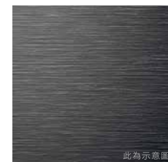
此為示意圖 霧黑楓木紋飾板 (旗艦款)