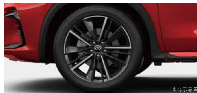
此為示意圖 20 吋劍影鋁合金輪圈