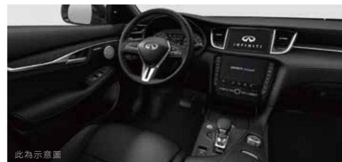
此為示意圖 墨石黑