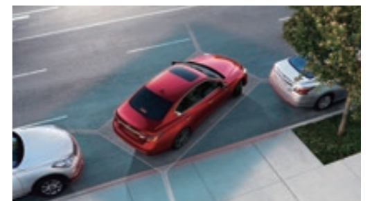
AVM 環景顯示附 MOD 物體偵測

可於倒車時主動偵測後方靜止或移動物體，消除視覺死角，於後方左右兩側偵測到物體時，將發出警示音提醒駕駛，於正後方預測到碰撞危險時，將主動緊急煞車，降低發生碰撞的風險。