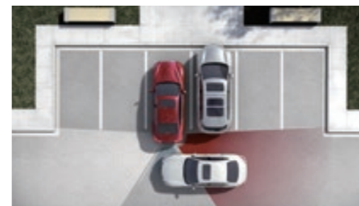
BCI 倒車後撞預防系統

透過後保桿內兩側的遠距感應雷達偵測後方來車，若雷達感知器偵測到偵測區域中有車輛，車側指示燈會自動點亮警示；若此時駕駛欲變換車道，啟動方向燈，車側指示燈會閃爍、發出警示音並主動啟動單側煞車，協助導正行車方向。