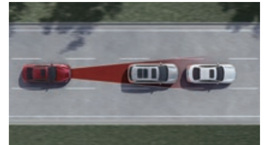
PFCW 超視距車輛追撞警示系統 FEB 自動急停輔助系統

當車速介於 0-144km/h 時，可依你的偏好設定三段安全車距，並根據前車的速度變化自動加速、減速，達到自動跟車的效果，並同時監控是否與前車保持足夠的安全距離，若與前車距離過近，將自動減速，預防煞車不及的狀況發生。