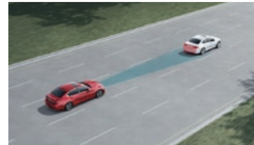
ICC 全速域智慧定速系統 DCA 車距控制輔助系統

當車速介於 0-144km/h 時，可依你的偏好設定三段安全車距，並根據前車的速度變化自動加速、減速，達到自動跟車的效果，並同時監控是否與前車保持足夠的安全距離，若與前車距離過近，將自動減速，預防煞車不及的狀況發生。