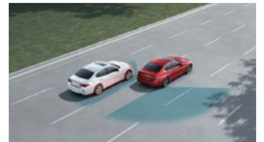
BSI 盲點側撞預防系統

車速於 70km/h 以上時啟動，偵測到車輛非刻意偏移車道時，將即時警示並主動啟動單側煞車協助導正行車方向。